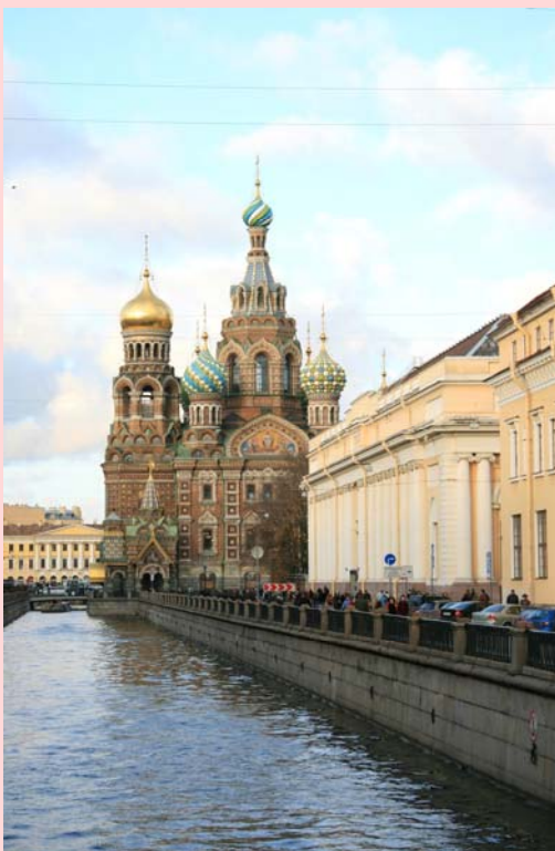
Vista dal canale Griboedova