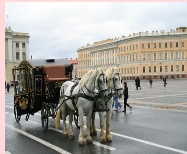
La Piazza del Palazzo d'Inverno e l'Hermitage

30 giorni prima della partenza il passaporto, con almeno 6 mesi di validità, deve essere consegnato presso la Ircam Viaggi, per l'apposizione del Visto di ingresso. E' necessario consegnare anche una fototessera retrofirmata e compilare un breve formulario fornito dall'agenzia.