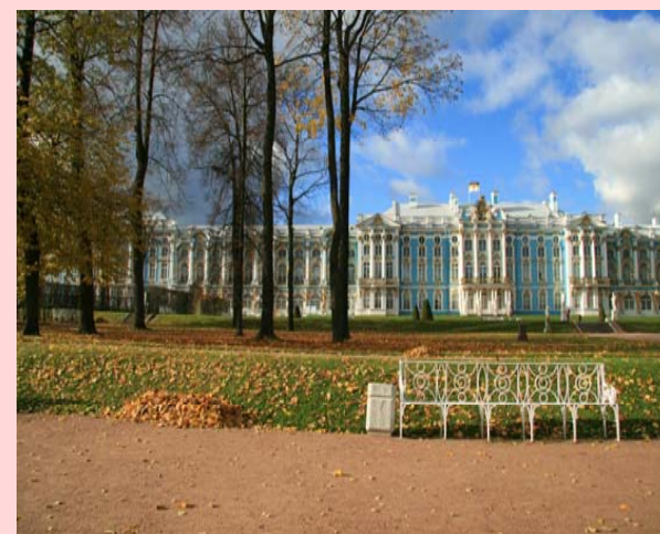
Residenza estiva dello Zar